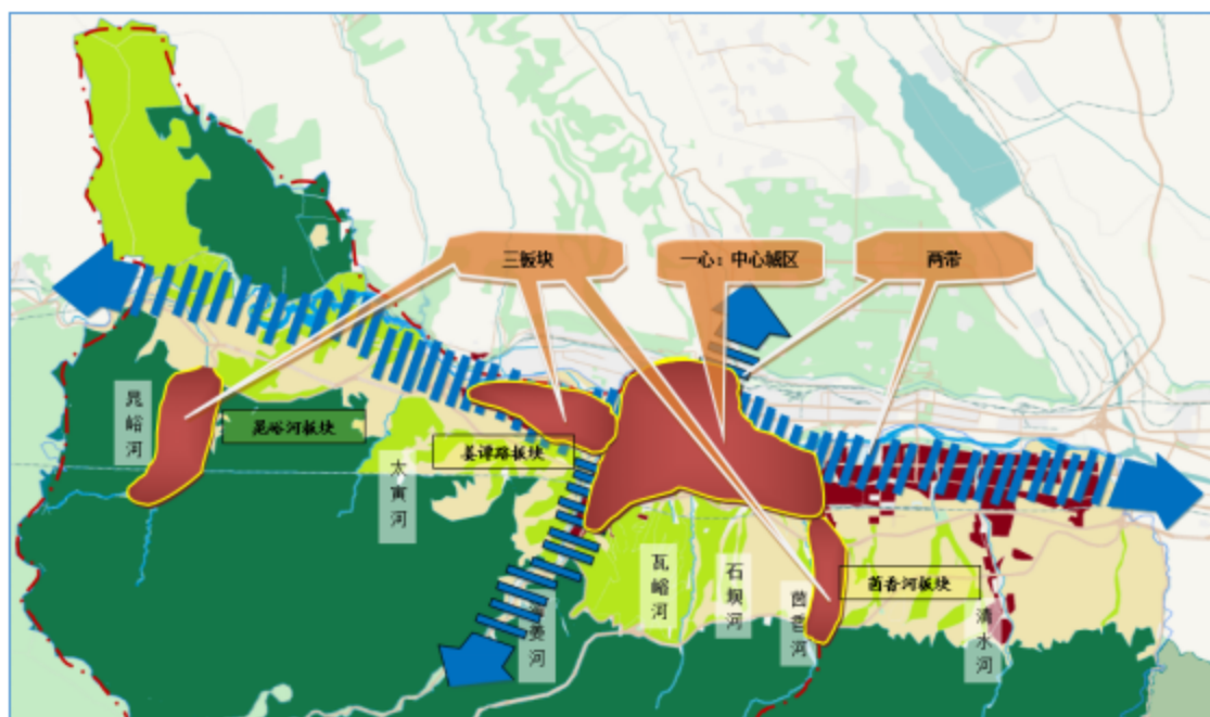
图 2 “十四五”渭滨区城乡发展空间布局示意图