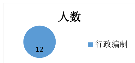
图 1 编制人数